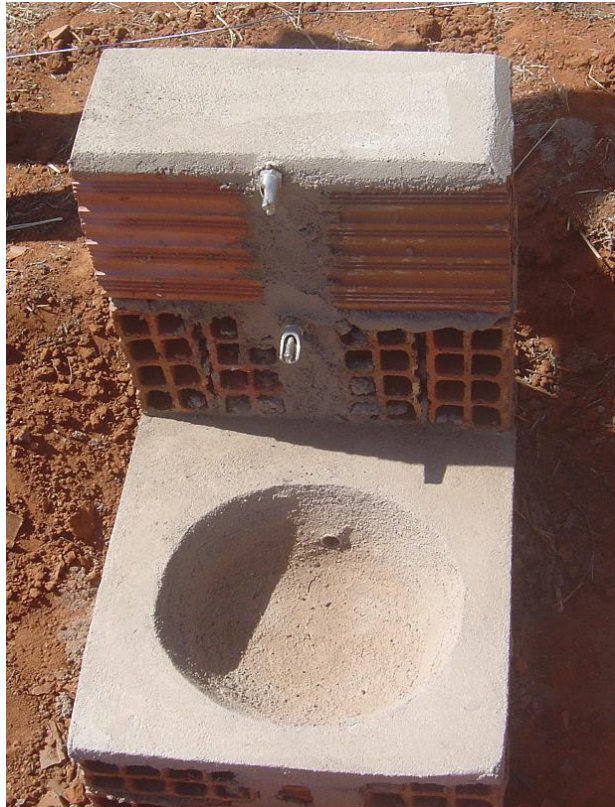
Figura 04. Bebedouro tipo chupeta