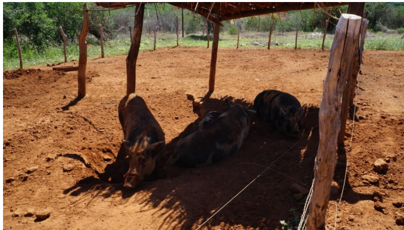
Figura 02. Piquetes

Os animais foram alojados em piquetes medido 10 m x 20 m (Figura 02), delimitados com cerca elétrica de três fios e tela metálica nº 16 de malha de 2" (Figura 03). Em cada piquete foram instalados comedouros com capacidade para a alimentação dos seis animais ao mesmo tempo (Figura 03), dois bebedouros tipo chupeta (Figura 04), uma coberta de bambus medindo 3 m x 3 m com estrutura de estacas de madeiras da caatinga, com fechamento lateral também de bambus (Figura 05) e, um micro aspersor elevado para frescos dos animais durante o dia (das 9 h às 14 h) (Figura 06).