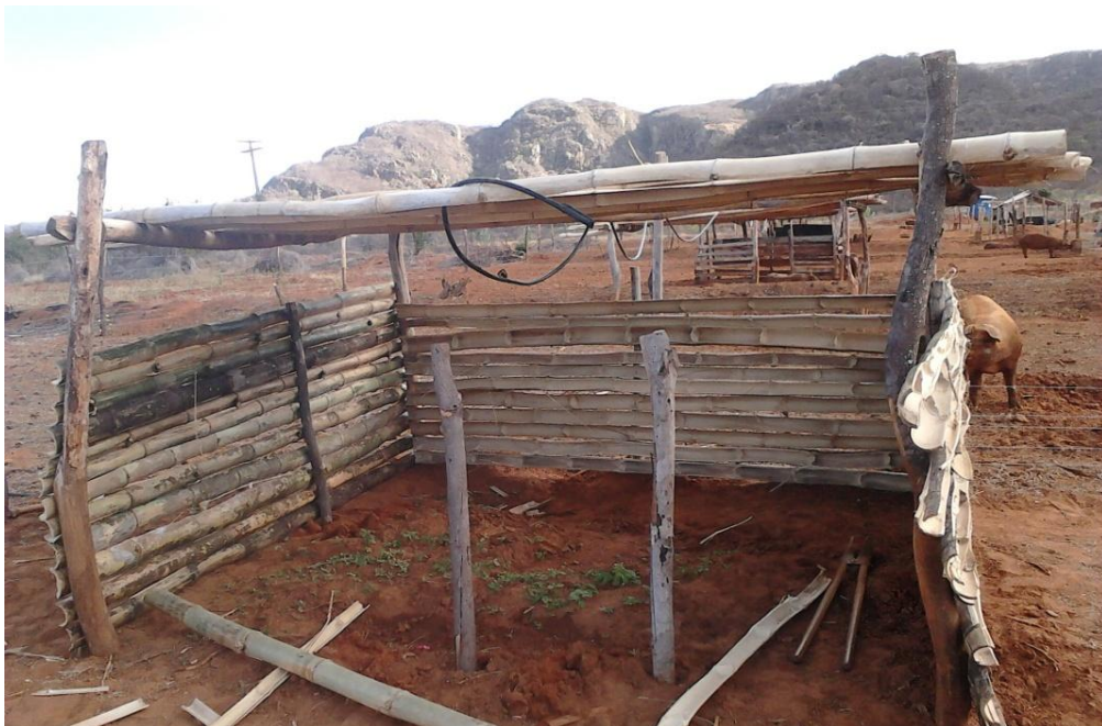
Figura 05. Coberta de bambus