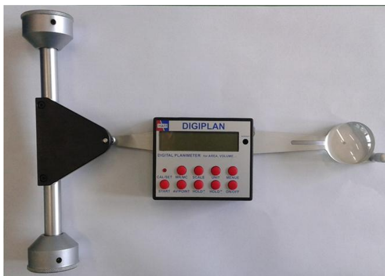
Figura 07. Planímetro Digital Haff modelo 301

A temperatura foi aferida ao concomitantemente ao pH por meio de um potenciômetro portátil com sonda de penetração específica para carnes. Os cortes comerciais e seus rendimentos foram pesados e calculados através da razão do peso do corte em relação ao peso da meia carcaça fria esquerda (PCFe), pela seguinte equação: RC = (PC/PCFe) * 100 . Foram pesados os seguintes cortes: Paleta (PAL), Pernil (PER), Carré (CAR), Costela (COS) e Pescoço (PES); seus rendimentos: Rendimento de Paleta (RPA), Rendimento de Pernil(RPE), Rendimento de Carré (RCR); Rendimento de Costela (RCO) e Rendimento de Pescoço (RPÇ).