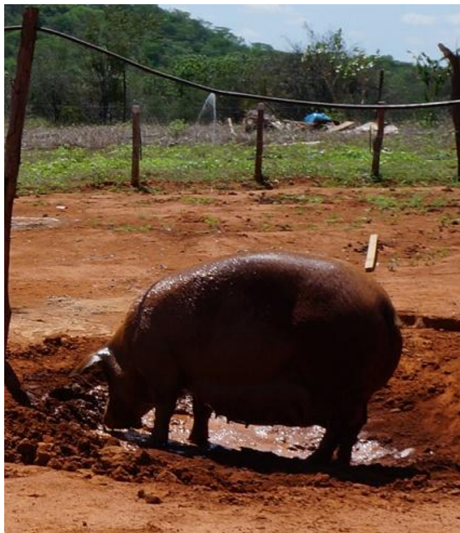
Figura 06. Microaspersão